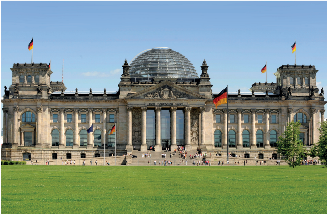
Das Reichstagsgebäude heute.

gierungssitz nach Berlin zu verlegen und das Reichstagsgebäude umzugestalten. Den Wettbewerb gewann 1994 der Brite Lord Foster. Der Umbau dauerte von 1995 bis 1999. Am 19. April 1999 gab es die feierliche Schlüsselübergabe und die erste Plenarsitzung. Im September nahm der Bundestag seine Arbeit in Berlin auf.