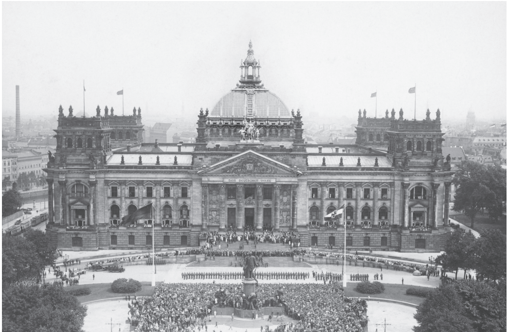
Blick auf das flaggengeschmückte Reichstagsgebäude, August 1926.

Nach der Gründung des Deutschen Reiches im Jahre 1871 fehlte eine würdige Tagungsstätte für das neue Parlament. Eine Reichstagsbaukommission wurde gegründet und die Entscheidung für einen Neubau getroffen. Bis zu dessen Fertigstellung tagte das Parlament in der Königlich Preußischen Porzellanmanufaktur in der Leipziger Straße 4.