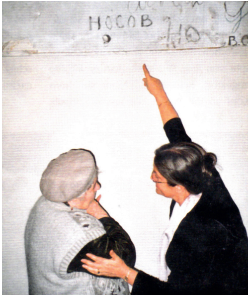
60 Jahre nach Kriegsende sieht die Witwe den Schriftzug ihres Mannes und dankt Gott dafür.